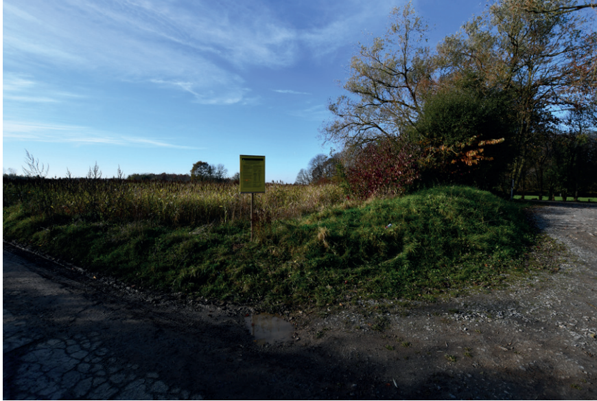
PRISE DE VUE : 2317