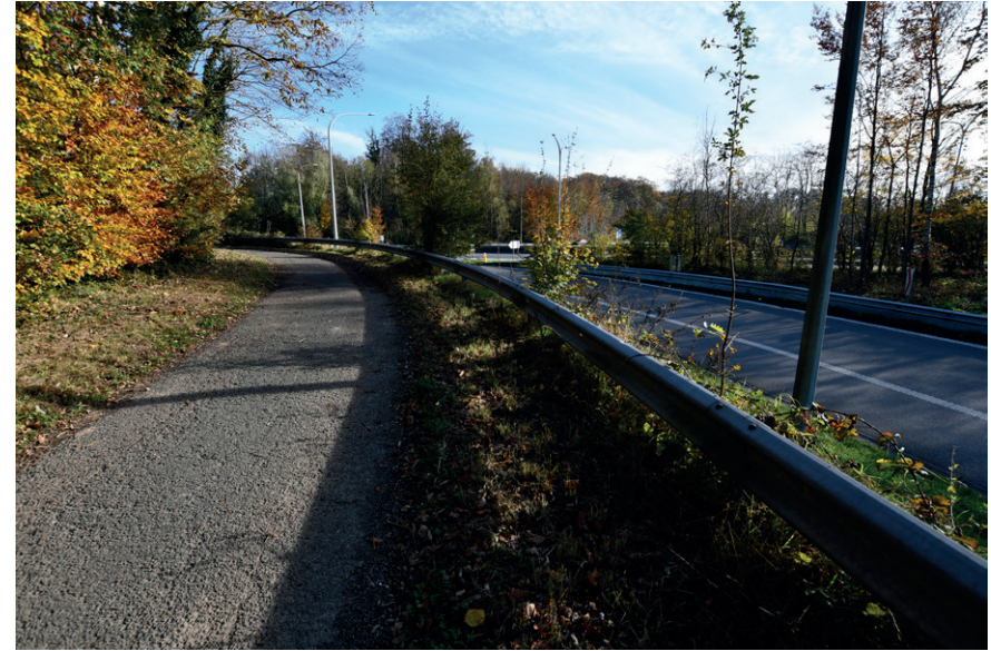
PRISE DE VUE : 2307