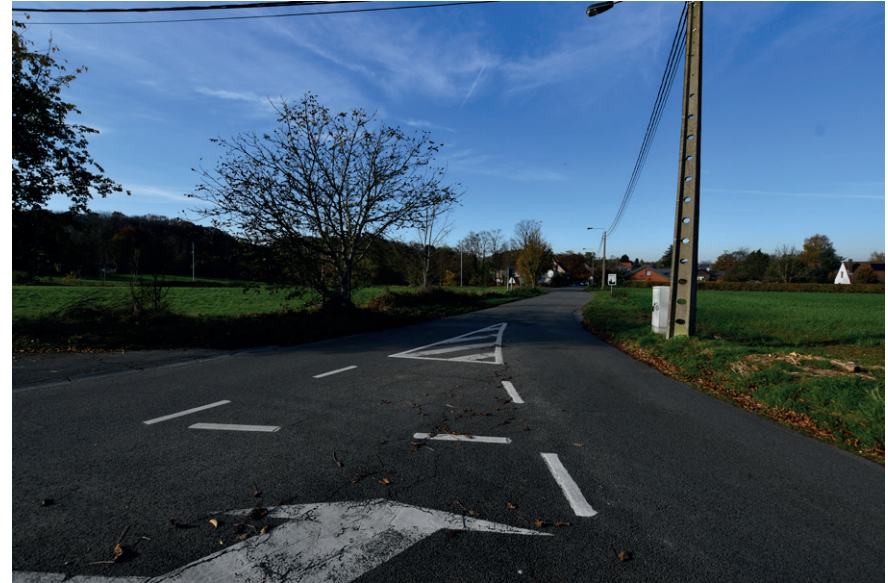
PRISE DE VUE : 2327