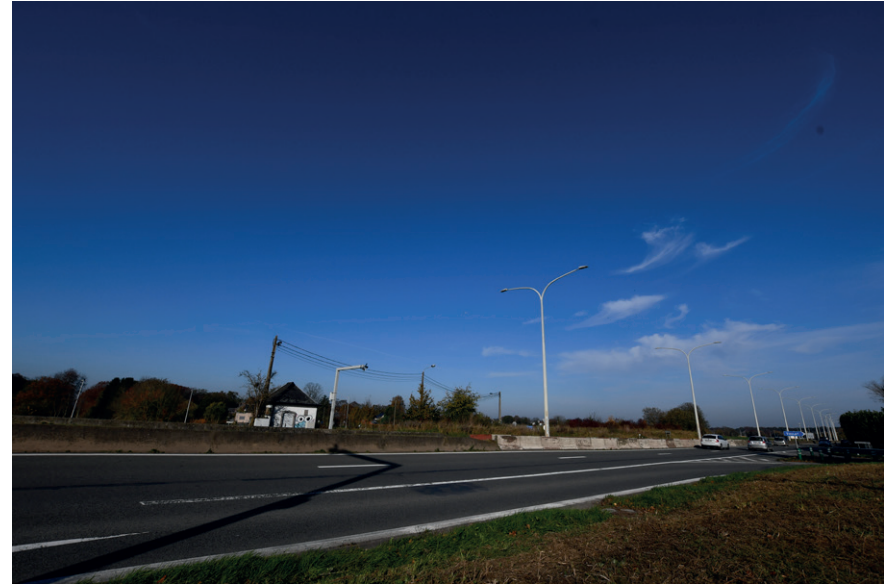
PRISE DE VUE : 2299