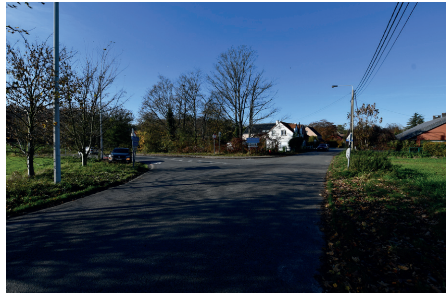
PRISE DE VUE : 2300