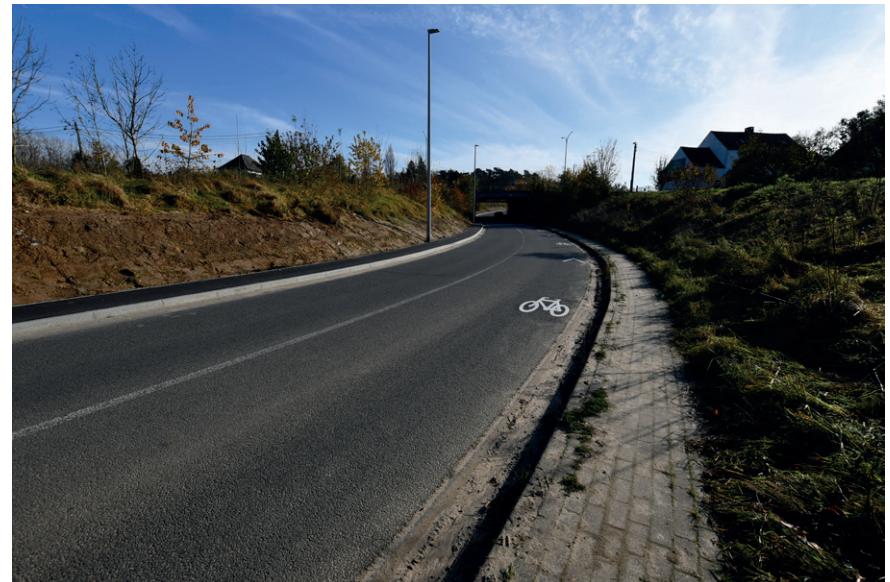
PRISE DE VUE : 2304