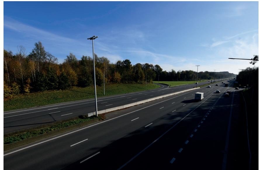
PRISE DE VUE : 2292