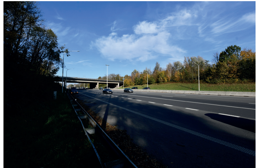
PRISE DE VUE : 2284