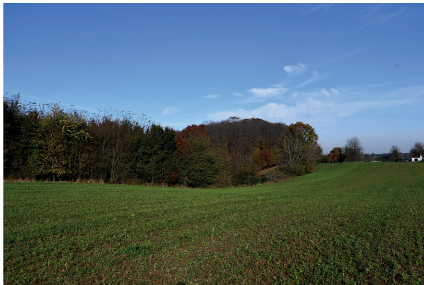
PRISE DE VUE : 2315