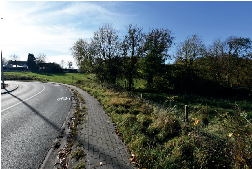
PRISE DE VUE : 2302