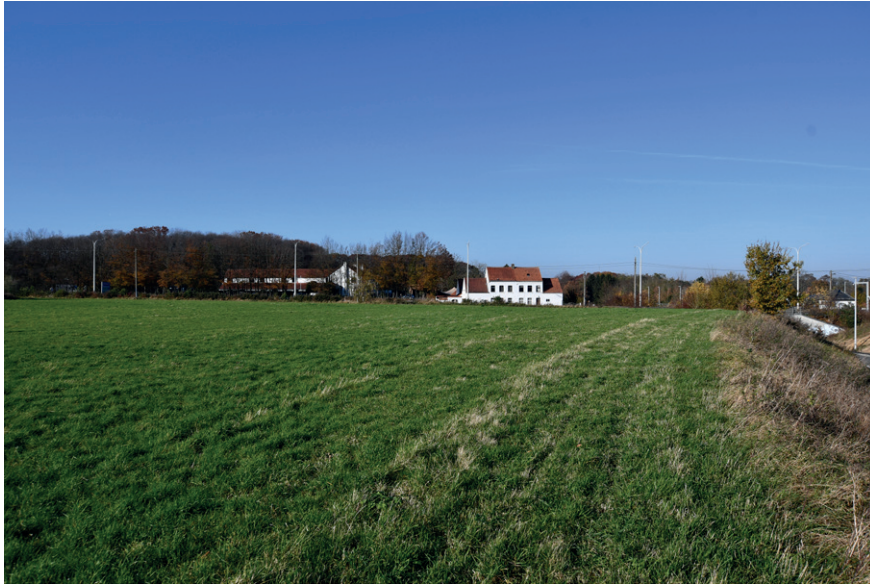
PRISE DE VUE : 2297