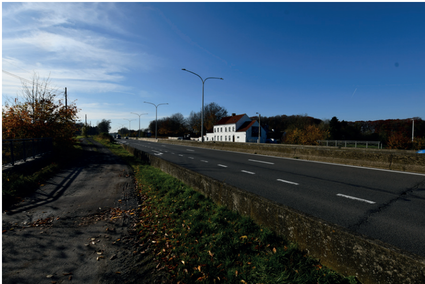
PRISE DE VUE : 2298