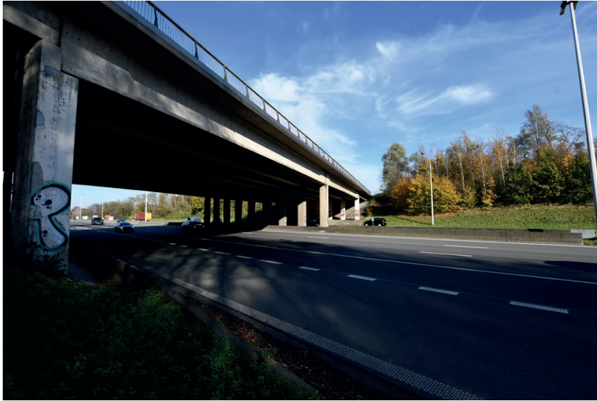
PRISE DE VUE : 2285