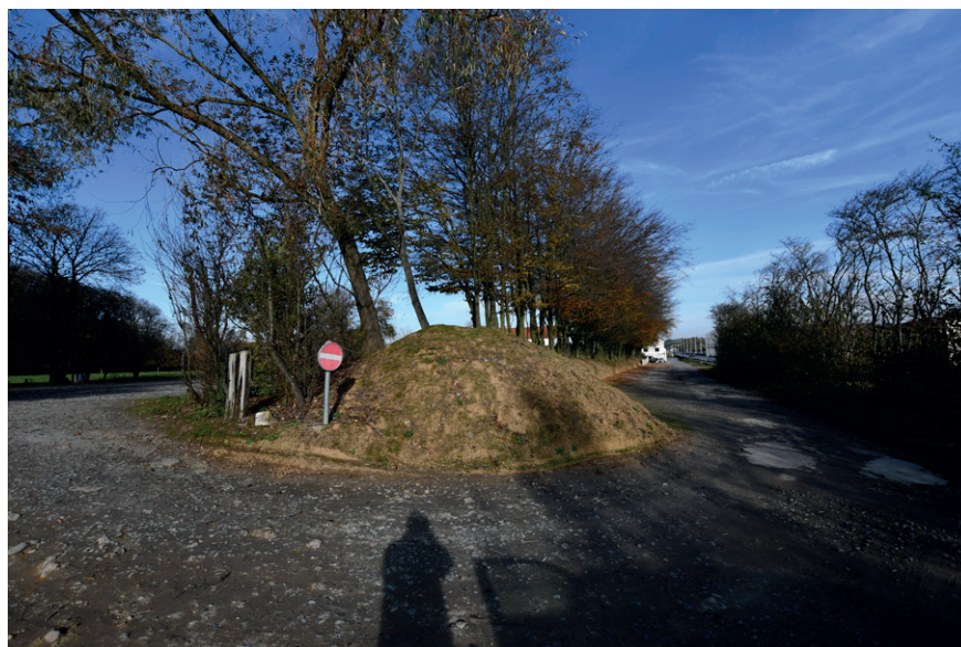
PRISE DE VUE : 2316