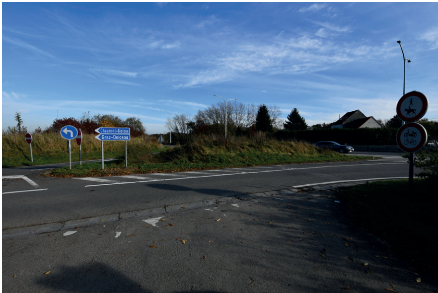
PRISE DE VUE : 2326