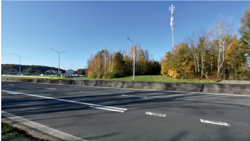
PRISE DE VUE : 2293