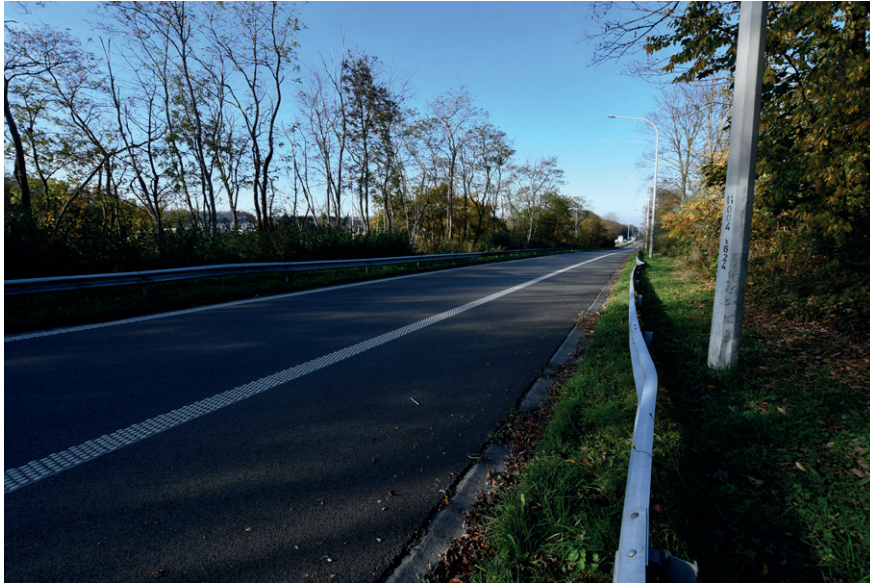
PRISE DE VUE : 2309