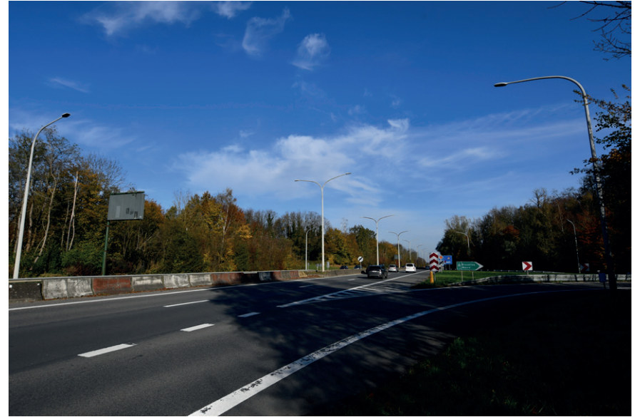
PRISE DE VUE : 2291