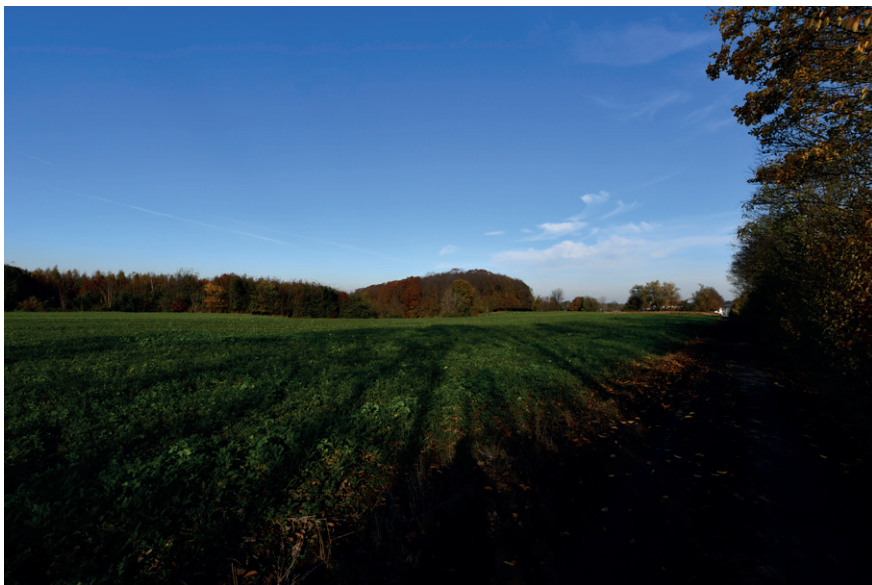
PRISE DE VUE : 2313