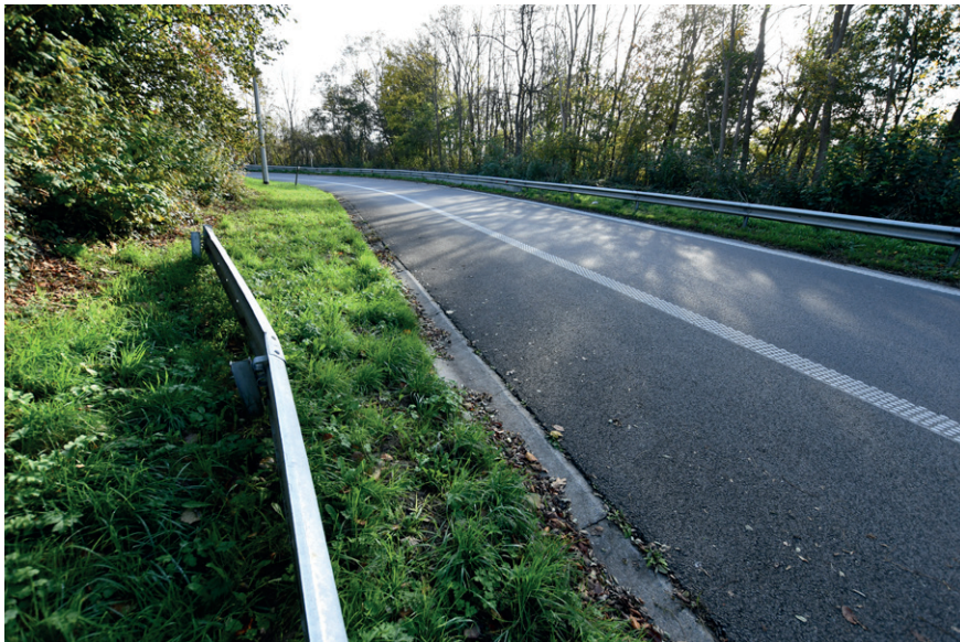
PRISE DE VUE : 2310