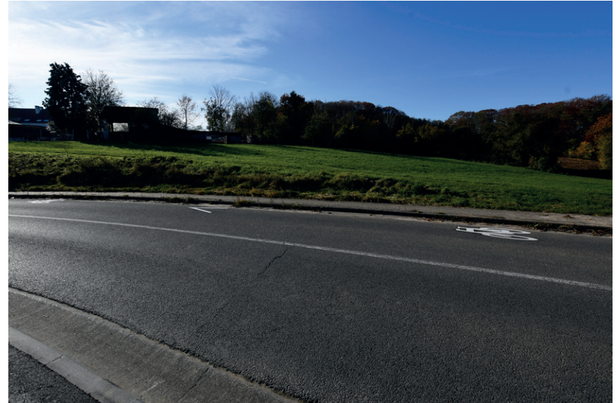
PRISE DE VUE : 2303