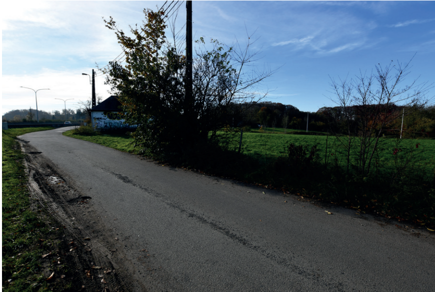
PRISE DE VUE : 2325