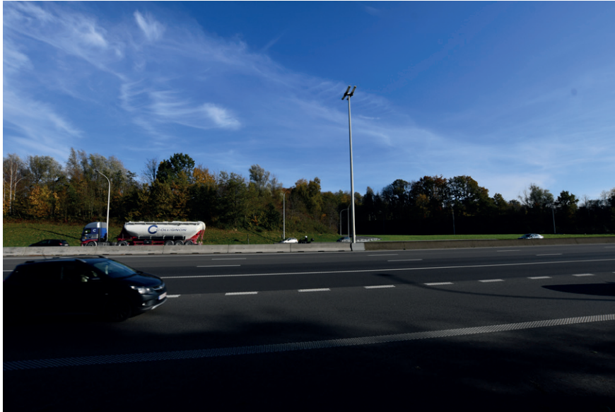
PRISE DE VUE : 2281