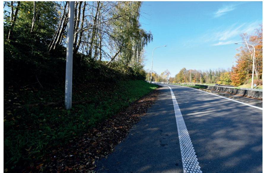
PRISE DE VUE : 2288