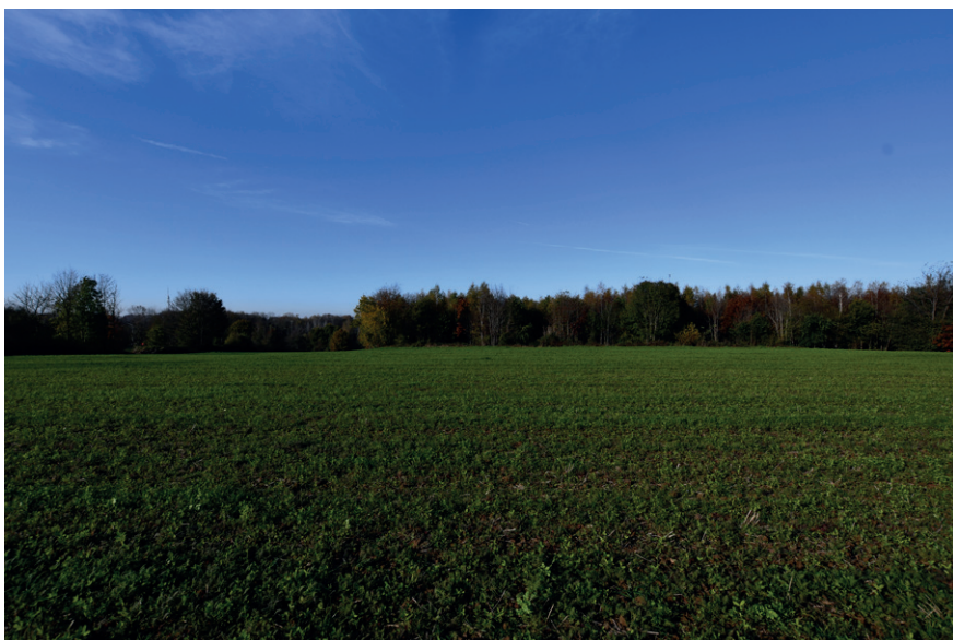
PRISE DE VUE : 2314