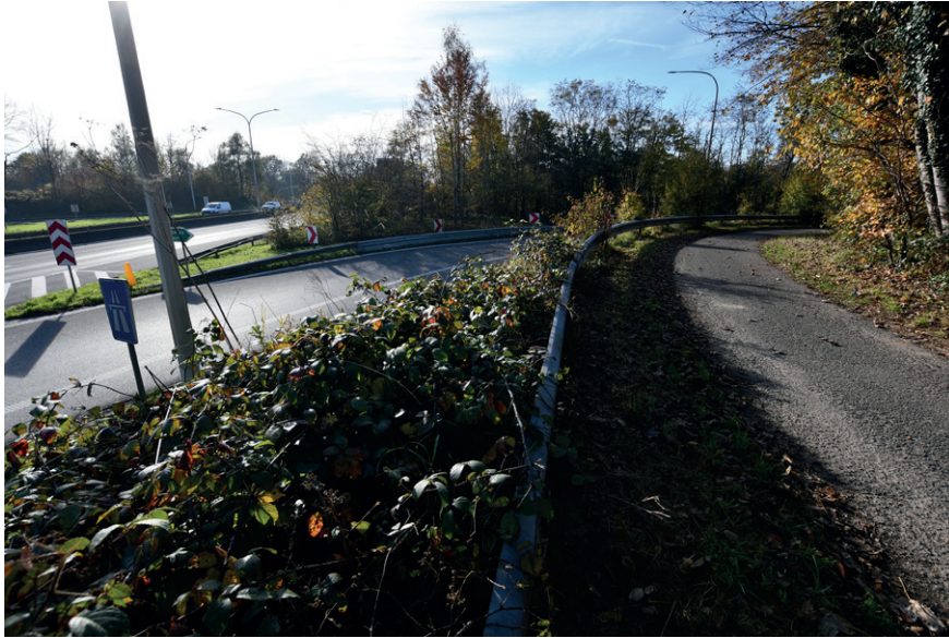
PRISE DE VUE : 2305