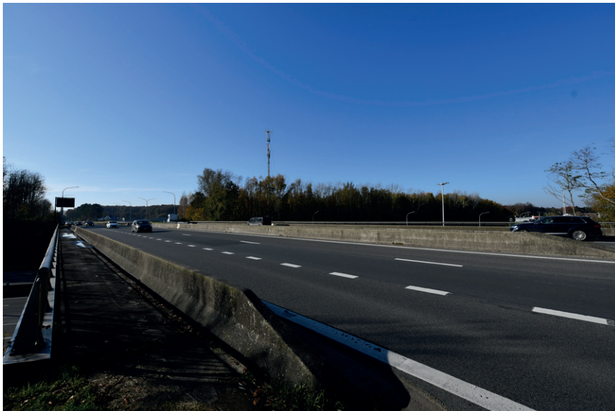
PRISE DE VUE : 2294