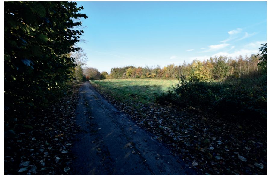
PRISE DE VUE : 2308