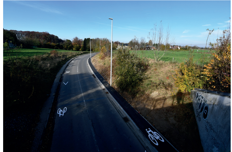
PRISE DE VUE : 2323