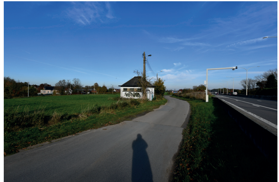
PRISE DE VUE : 2324