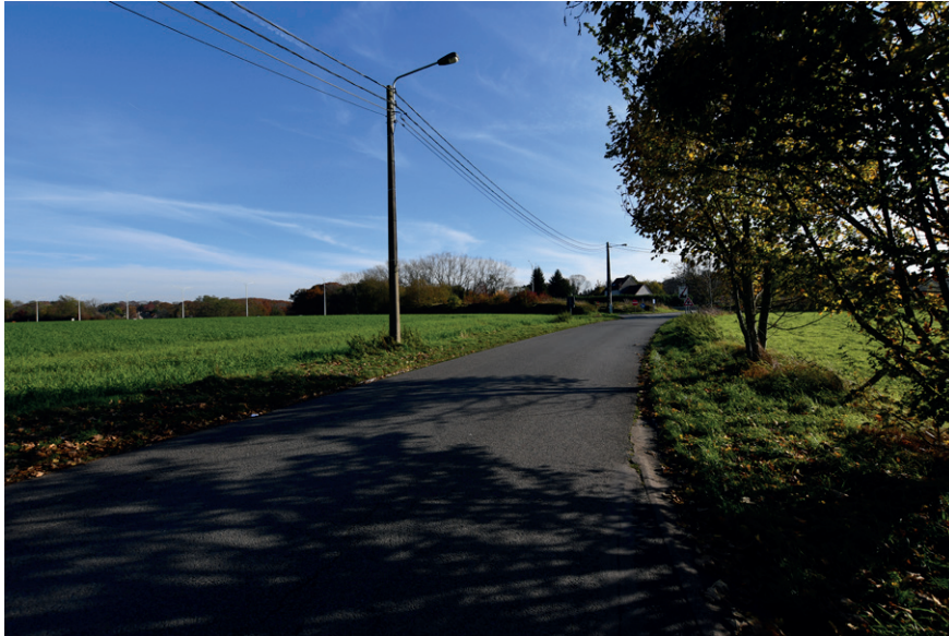
PRISE DE VUE : 2301