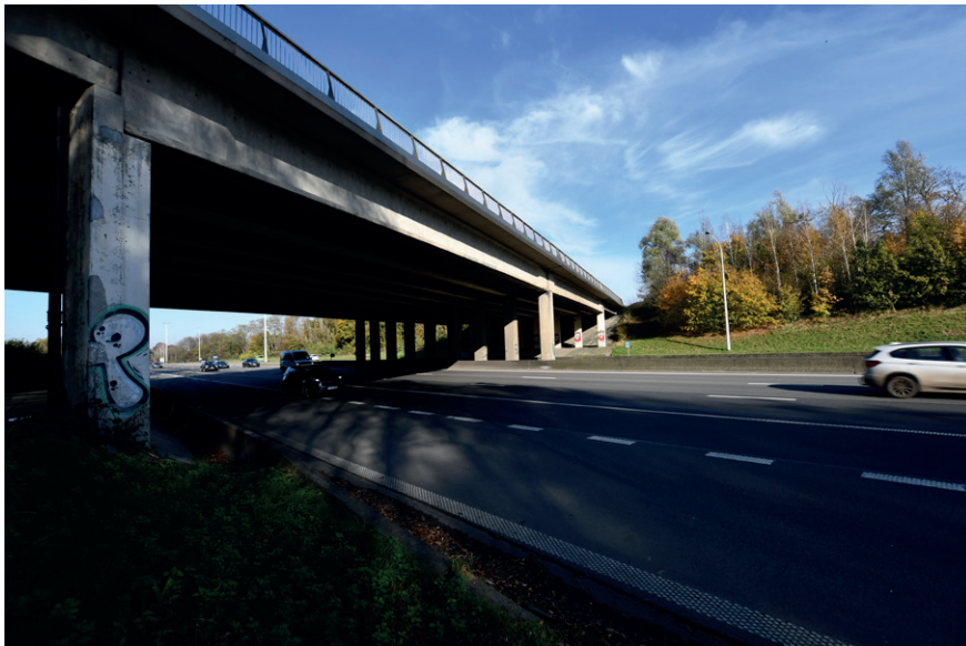
PRISE DE VUE : 2286