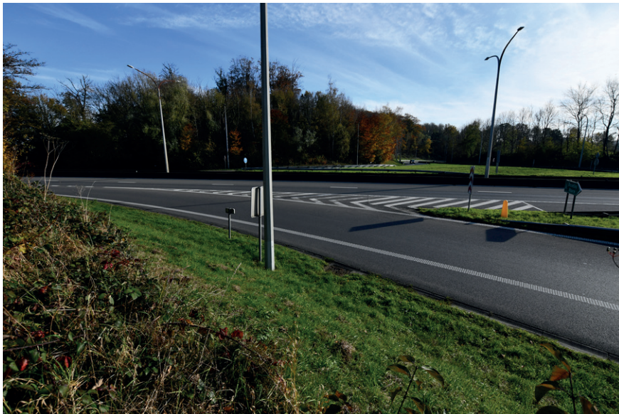
PRISE DE VUE : 2306