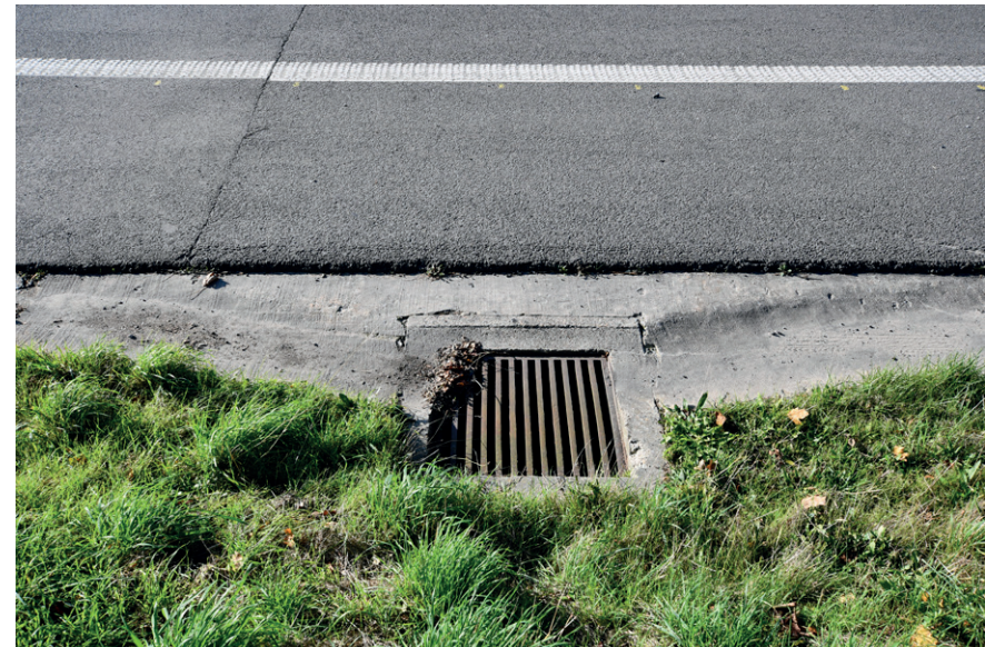
PRISE DE VUE : 2296