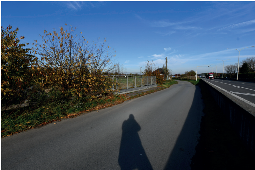
PRISE DE VUE : 2322