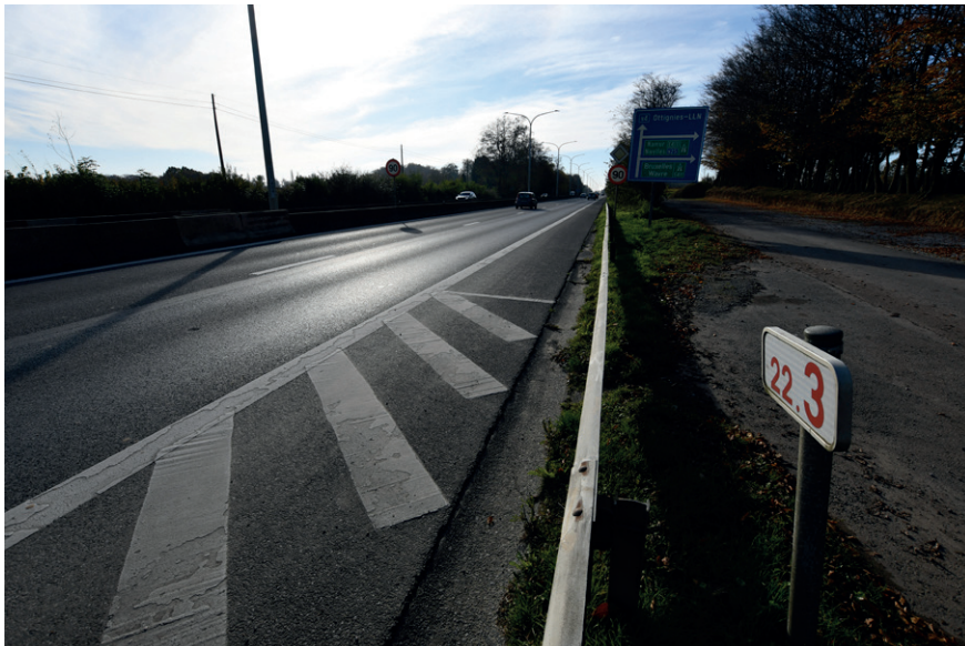
PRISE DE VUE : 2318