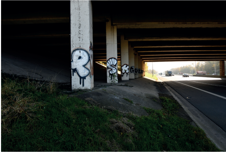
PRISE DE VUE : 2289