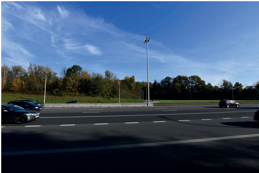
PRISE DE VUE : 2282