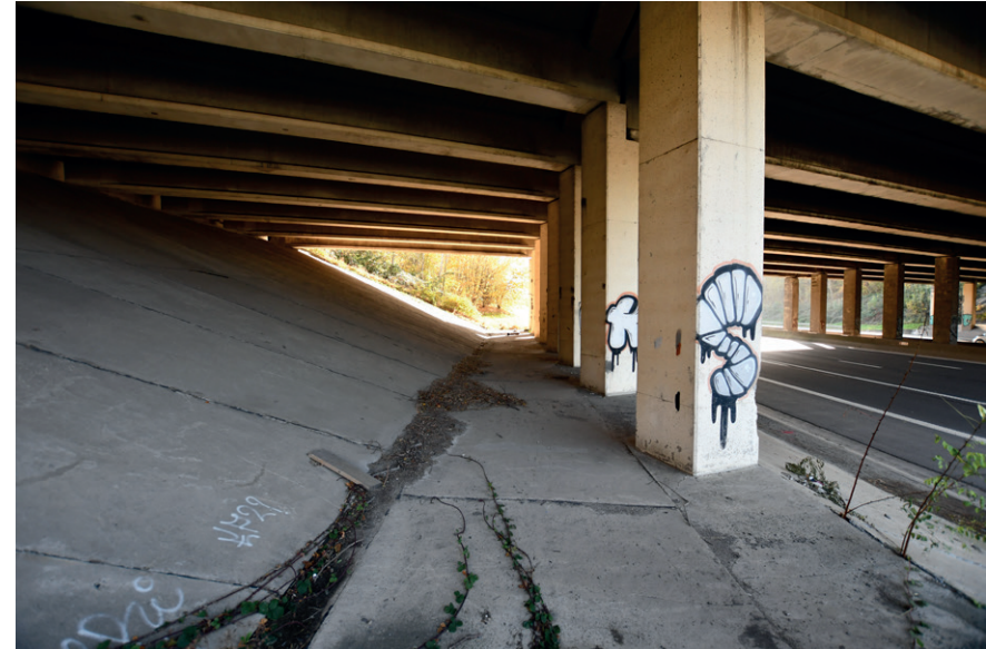
PRISE DE VUE : 2295