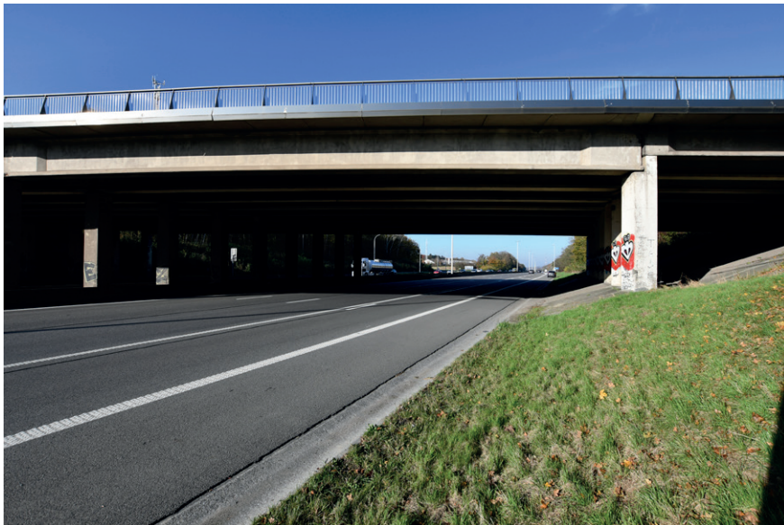
PRISE DE VUE : 2290