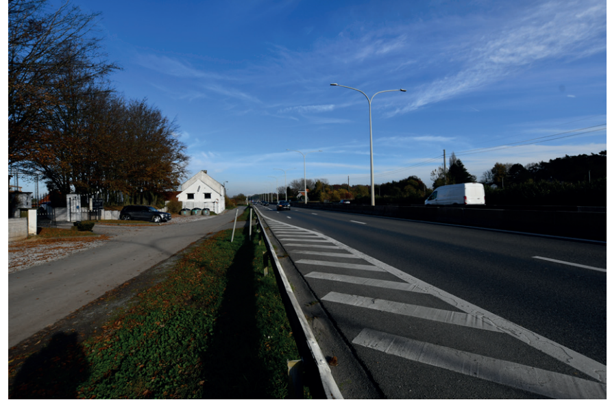
PRISE DE VUE : 2319