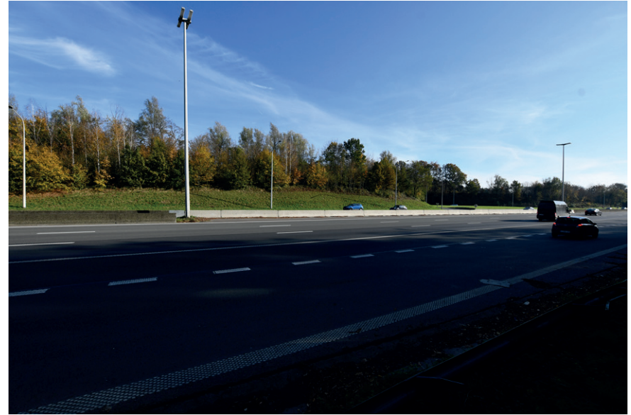
PRISE DE VUE : 2287