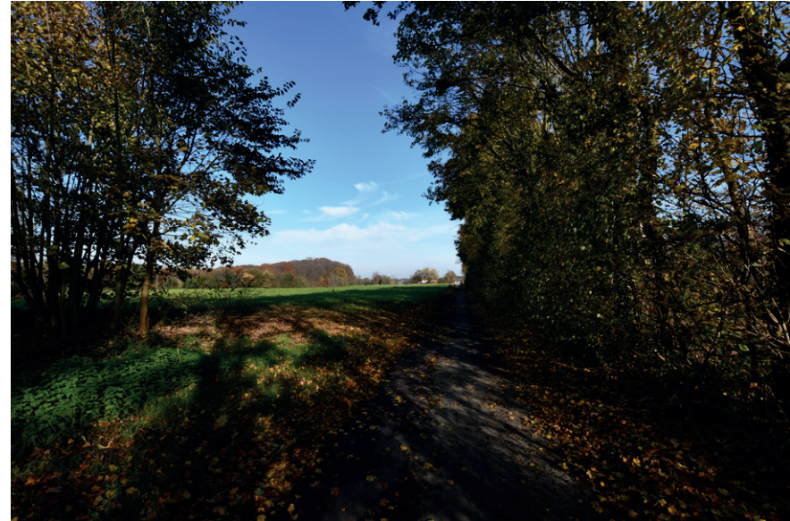
PRISE DE VUE : 2311