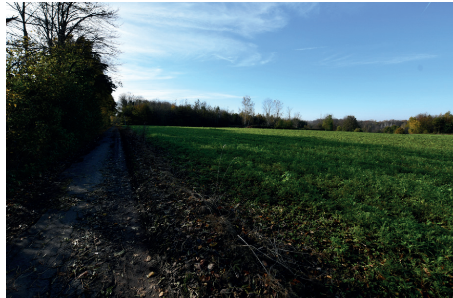
PRISE DE VUE : 2312