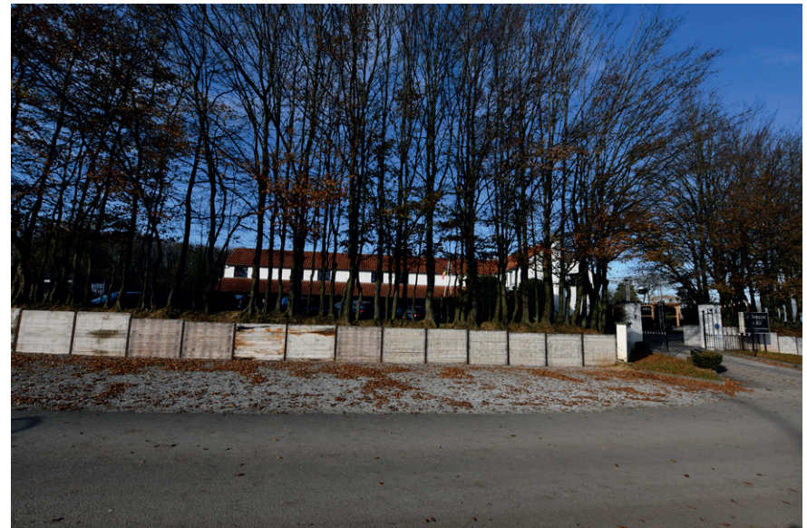
PRISE DE VUE : 2320