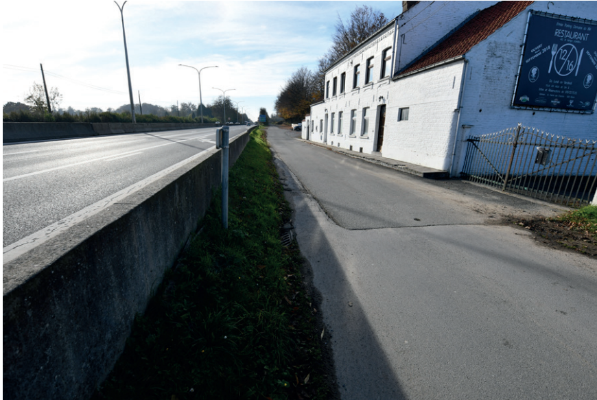
PRISE DE VUE : 2321