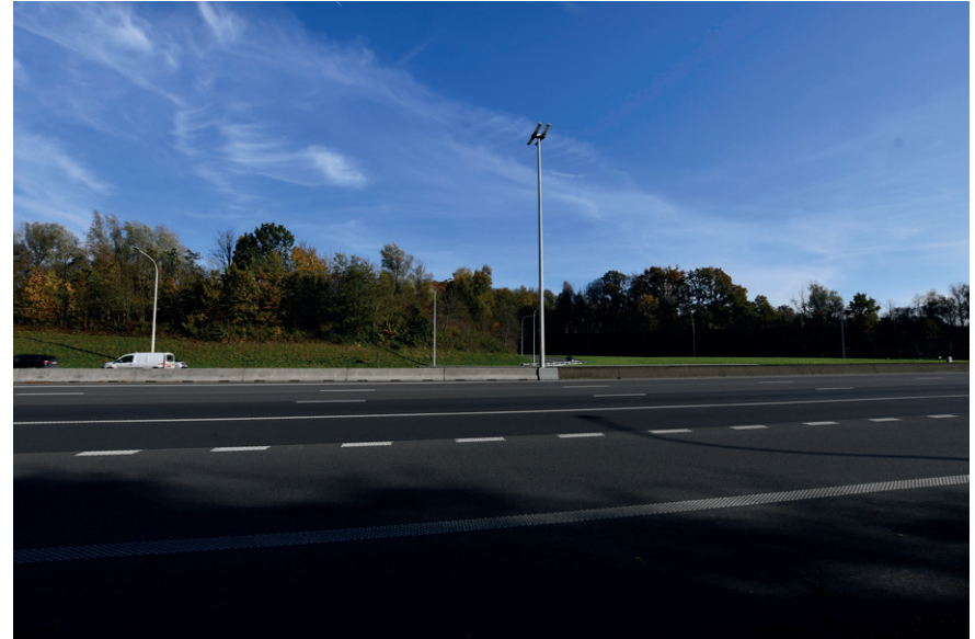
PRISE DE VUE : 2283